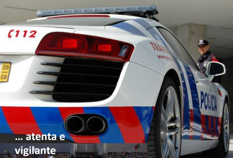
... atenta e vigilante