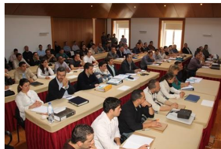
Formação Ambiental – IGAMAOT/COMETLIS (Maio de 2012)