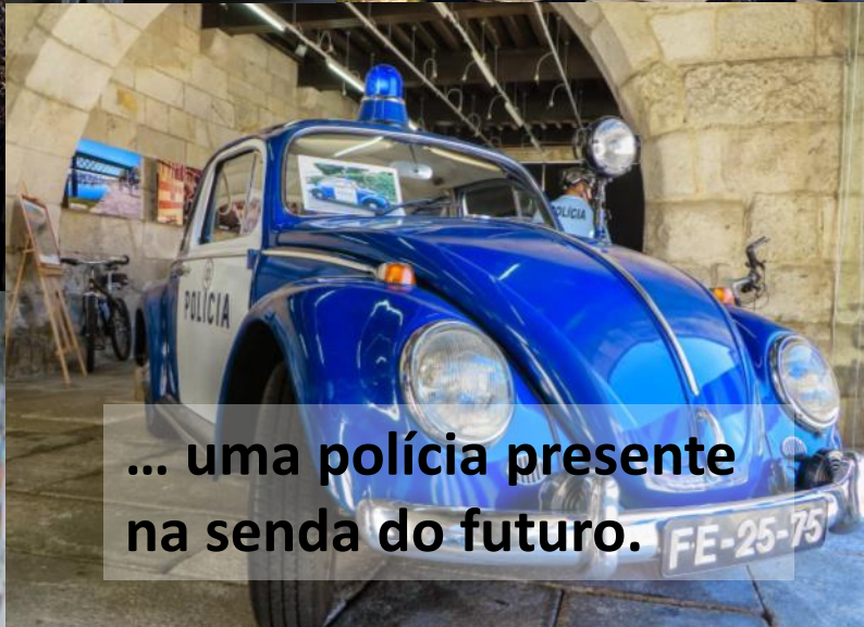
... uma polícia presente na senda do futuro.