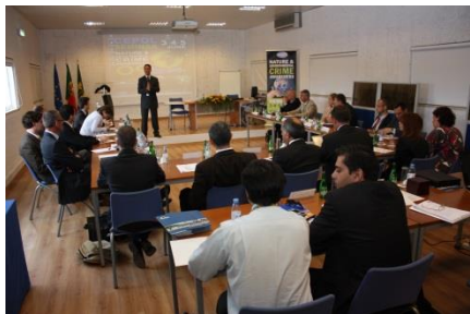
Cepol Nature & Environmental Crime Awareness Seminar (3 a 5 Junho de 2009)