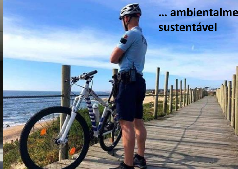
... ambientalmente sustentável