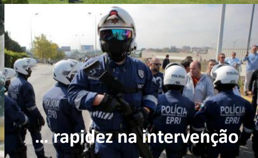
... rapidez na intervenção